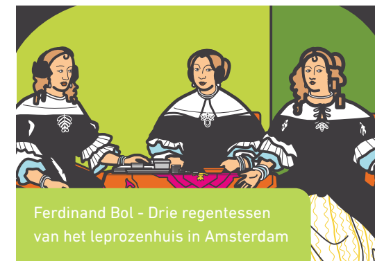
Ferdinand Bol - Drie regentessen van het leprozenhuis in Amsterdam